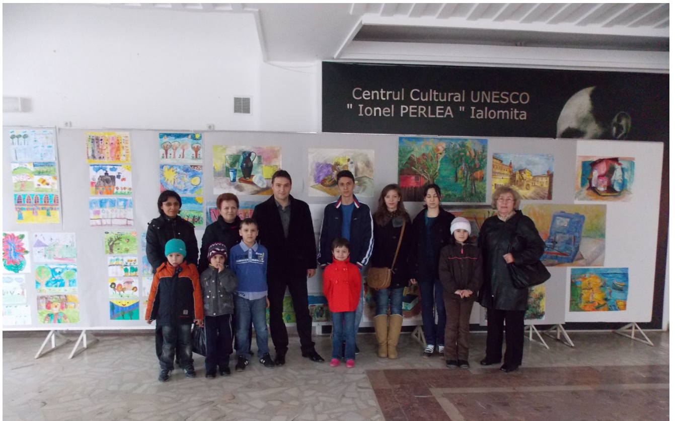
Premiere – Concurs Paleta Primaverii