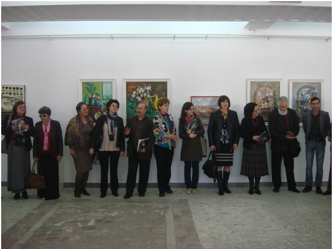
Salonul de toamna