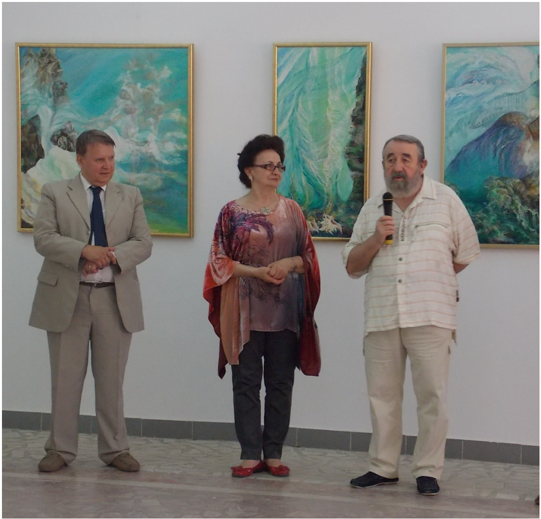
Trei pictori doua generatii – vernisaj