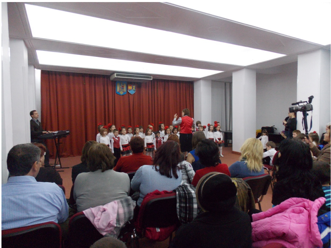
Spectacol Sunetul Muzicii