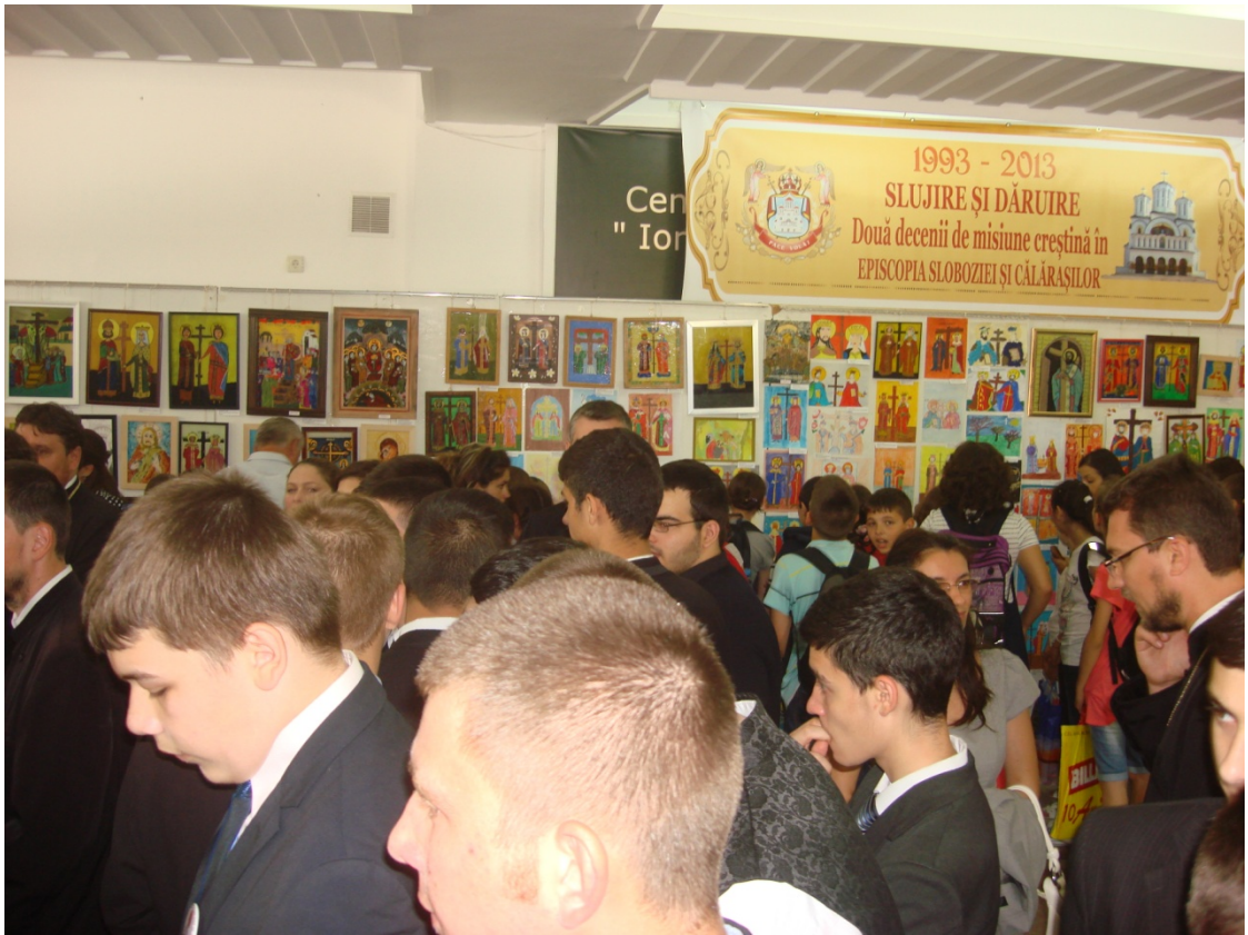
Expozitie de icoane