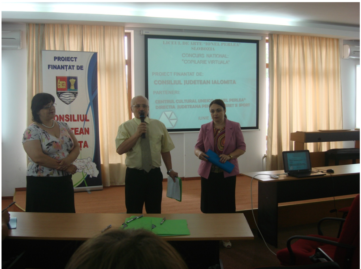
Premiere – Concurs Copilarie Virtuala