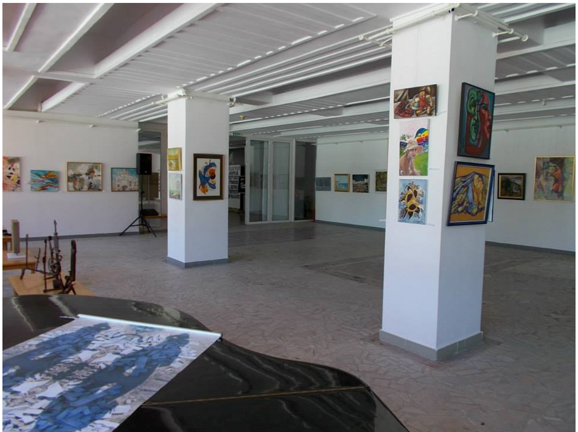
Salonul National de arta contemporana