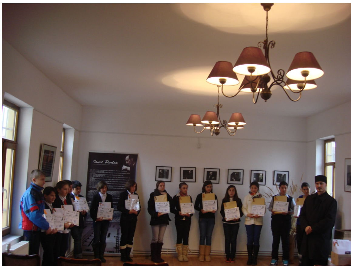
Premiere – Concurs 13 decembrie