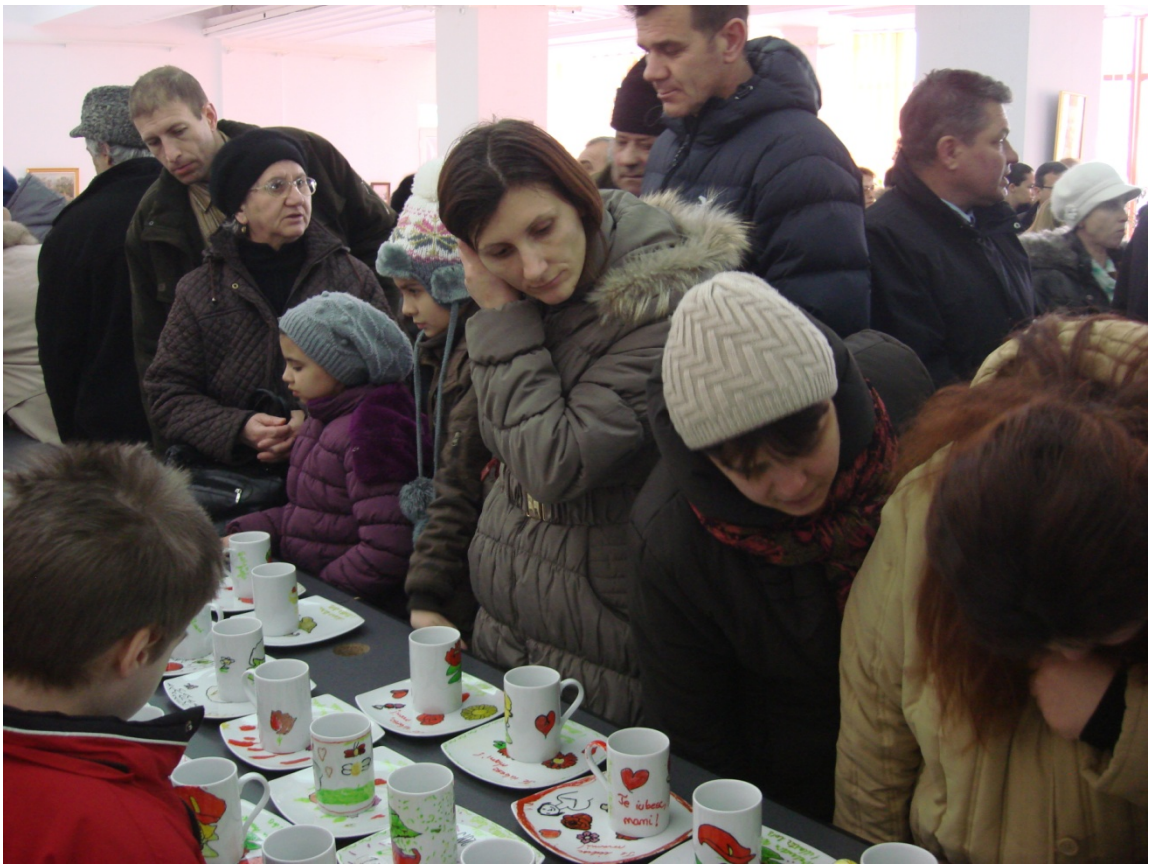
Atelier de pictura pe portelan