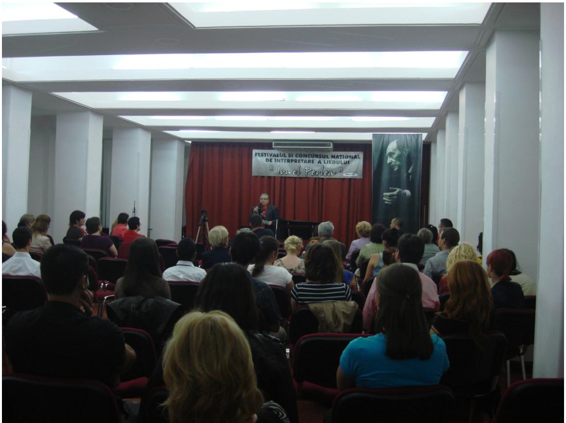
Festivalul si Concursul Ionel Perlea