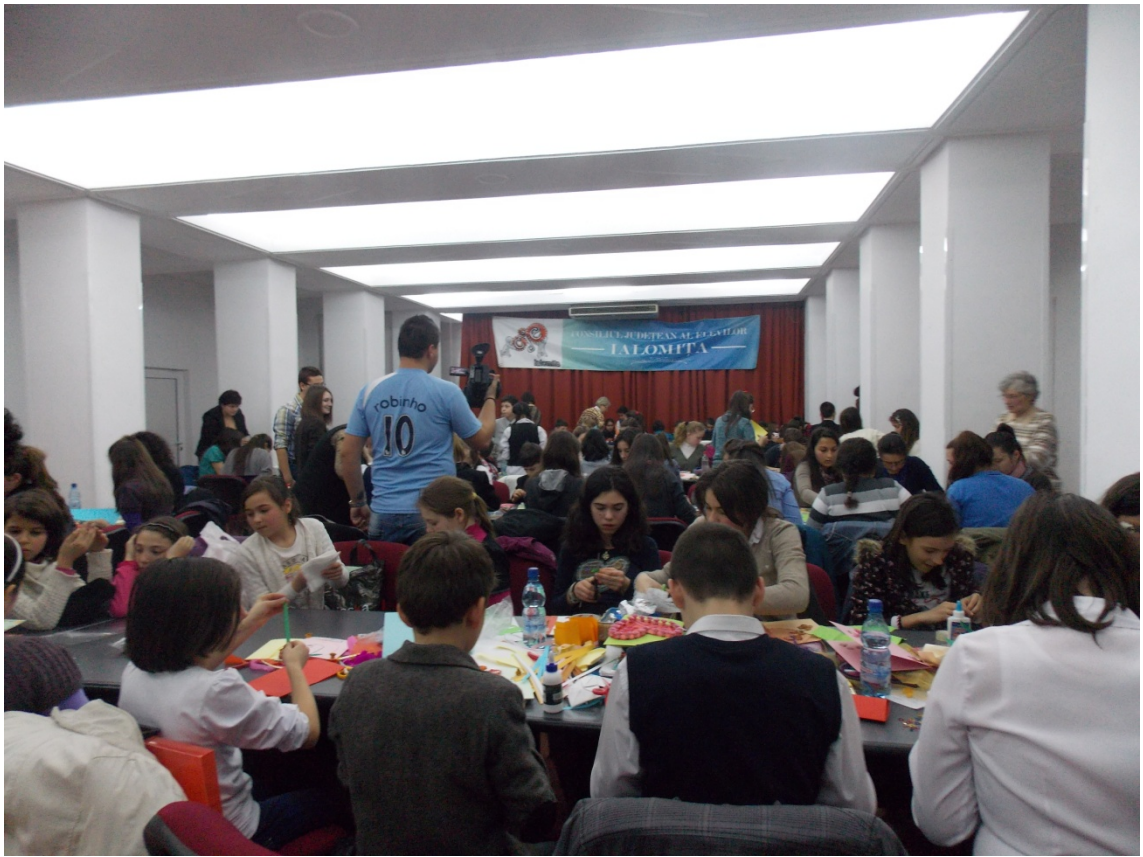
Atelier de felicitari