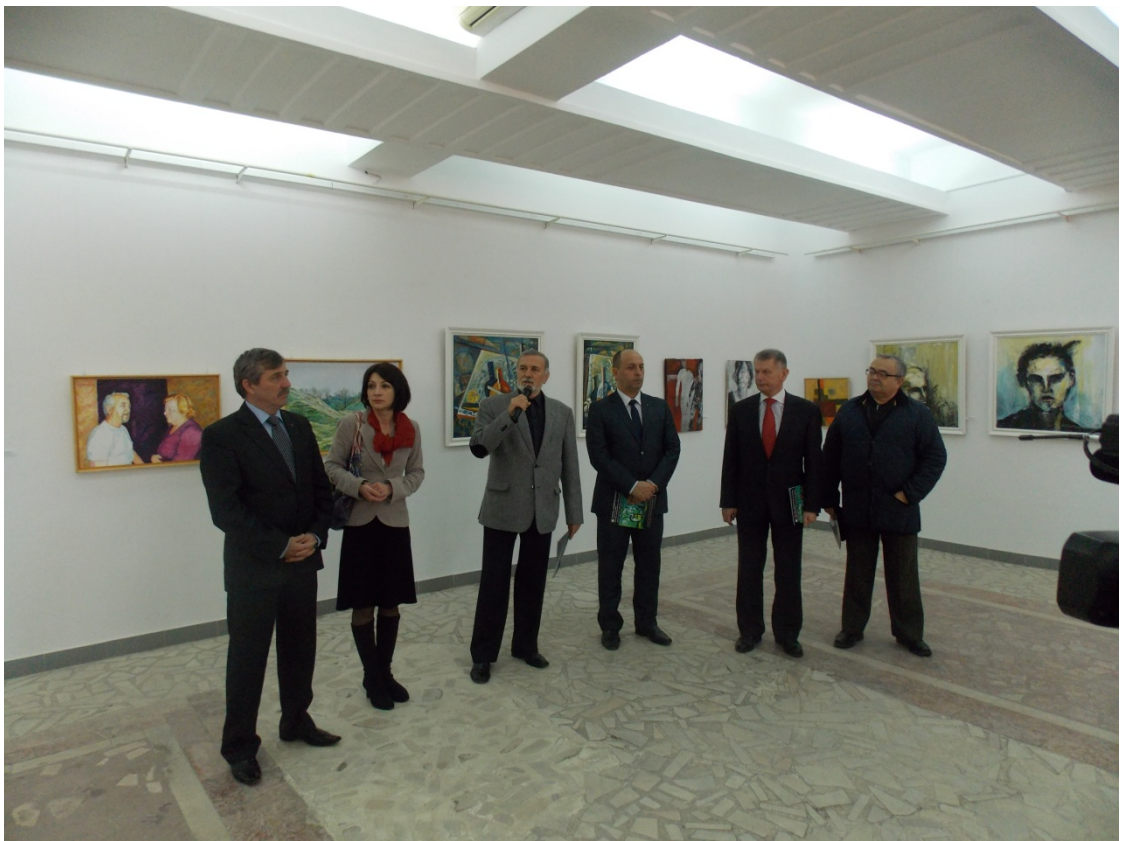
Vernisaj – Salonul de primavara