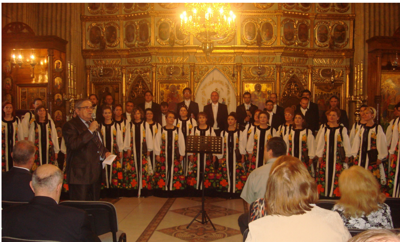
Recital corul Madrigal