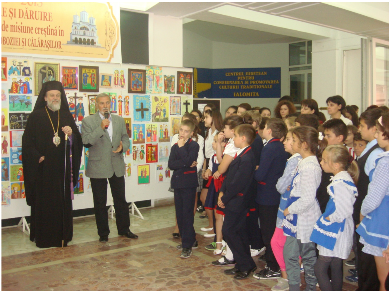
Premiere Expozitie icoane