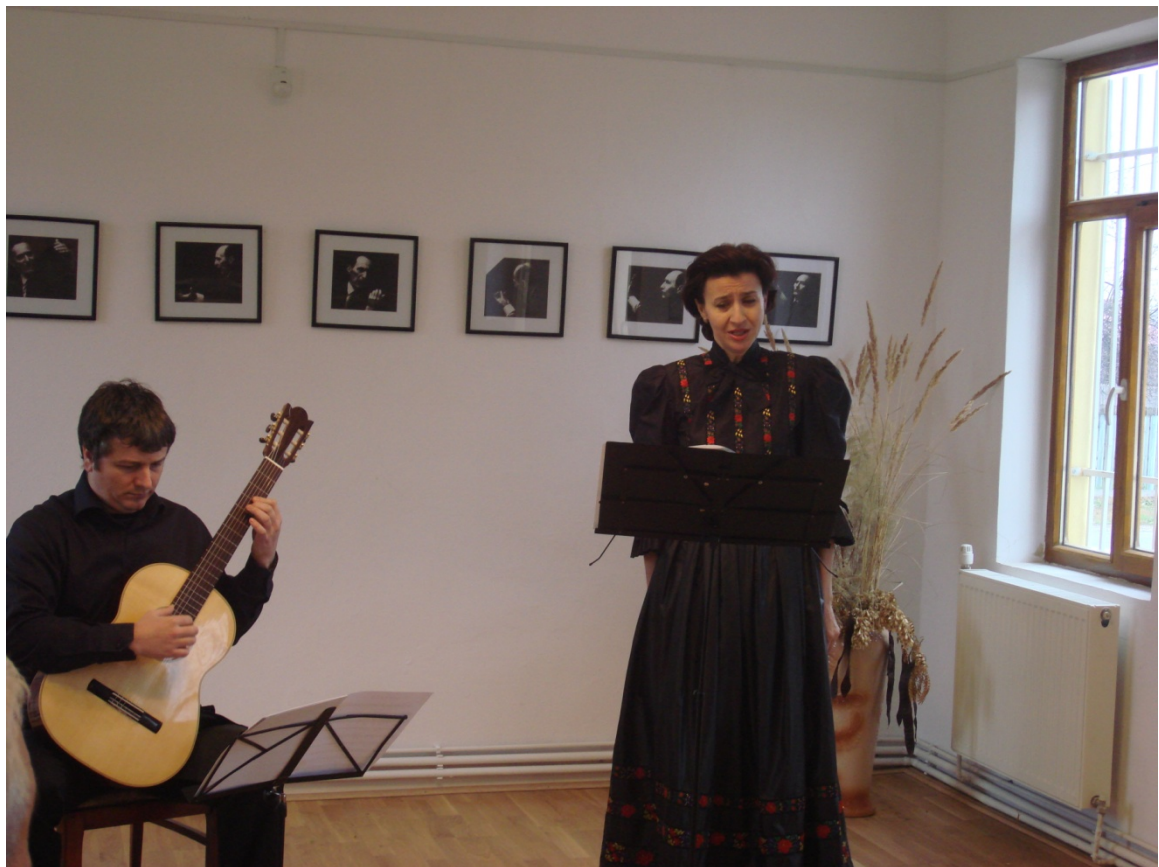
Recital Ograda – 13 septembrie