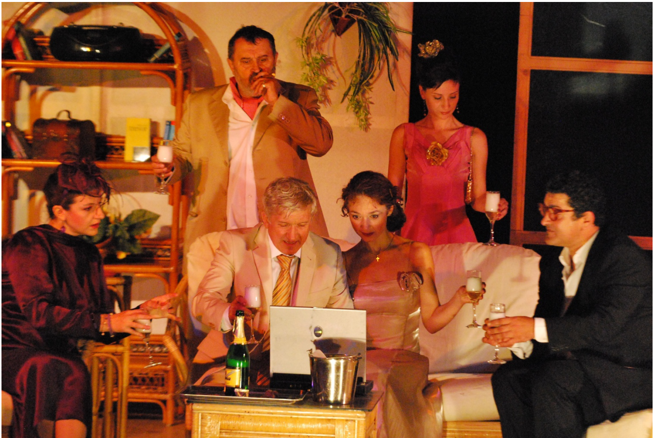
Piesa de teatru Vacanta in Guadelupa