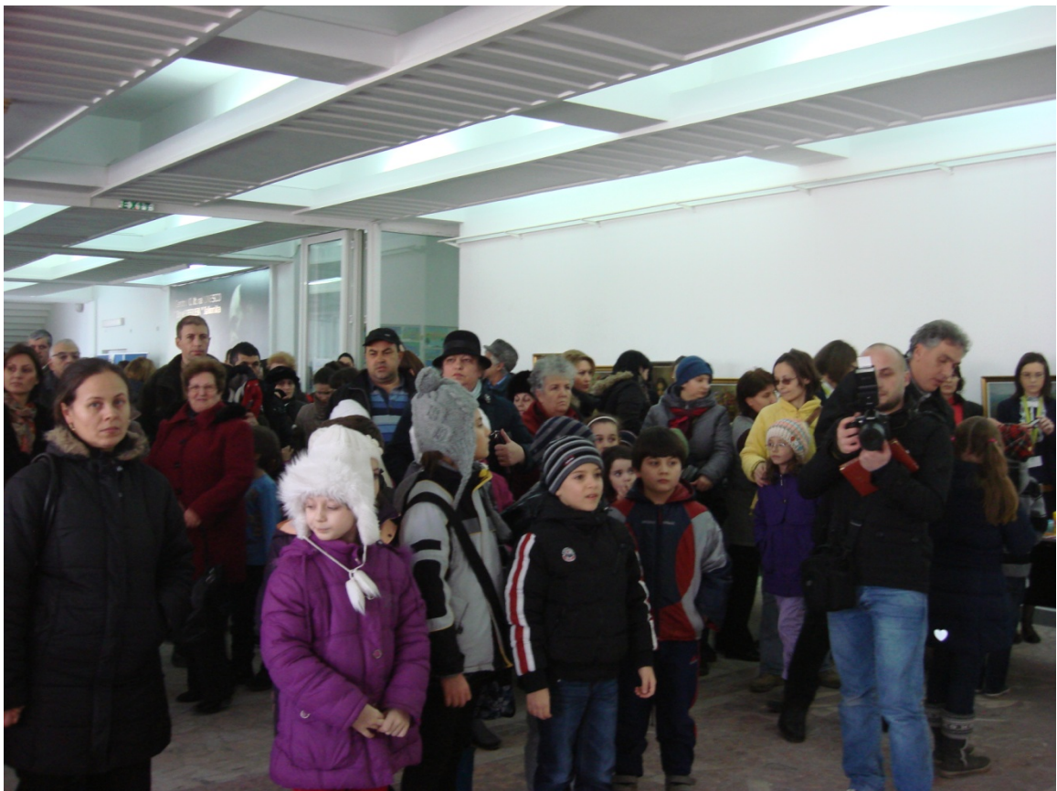
Premiere – Atelier de pictura pe portelan