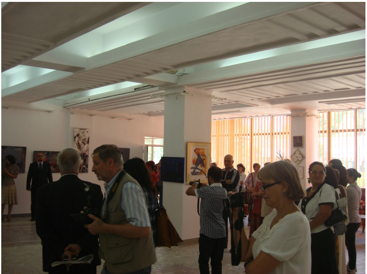
Atitudini plastice contemporane – vernisaj