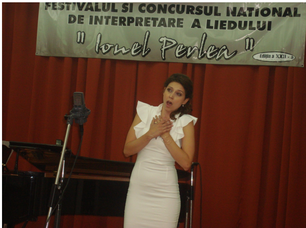
Marele Premiu – Festivalul Ionel Perlea – Stanca Manoleanu